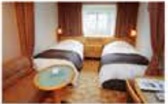
スーパーリアツイン / 14～18㎡