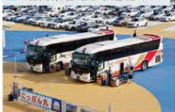
3 北関東各地から連絡バス

北関東・南東北・首都圏から連絡バスが運行予定のため、スムーズにご乗船いただけます。