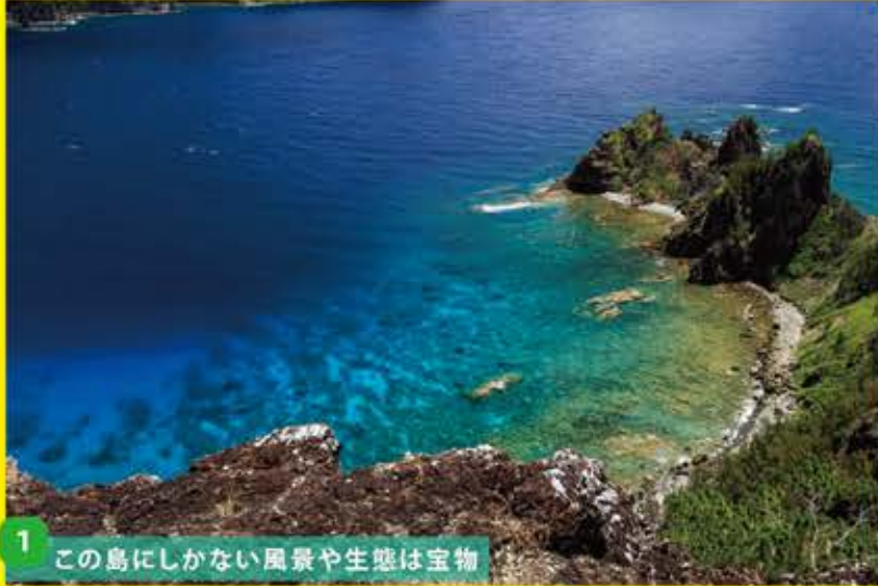
1 この島にしかない風景や生態は宝物