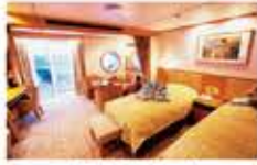
ビスタスイート / 37㎡～42㎡