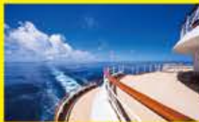
1.長崎と呼ばれる東側の海を望む美しい岬 2.小笠原が旅行者を惹きつけて止まない理由のひとつが、このお見送り。二日間の滞在を共にした地元の方々が盛大に祝ってくれる様は一生忘れられない 3.小笠原への航海は日本とは思えないようなエメラルドの海が広がっている 4.化石となった珊瑚の体積によって出来た美しいビーチはまさに世界遺産 5.停泊する二見湾は宝石のような美しさ