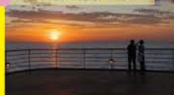
2 食前食後の絶景を楽しむ

写真左：デッキの上からは想像も出来ないような美しい太陽が待っています。海と空と太陽が織りなす絶景時間はかけがいの無い思い出になると思います。写真右：船上で召し上がる一品は陸上とは違った妙味に溢れています。席の隣の窓から眺める景色もまた贅沢。