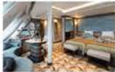
オーシャンビュースイート / 33㎡