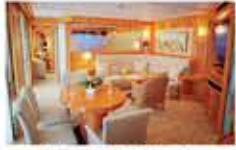
グランドスイート / 79㎡