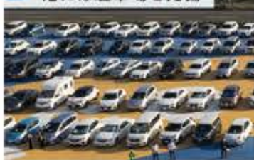
2 港には駐車場を完備

ご自宅から車で出発して駐車場は岸壁にあるので、ドアツードアまでのご案内が叶います。