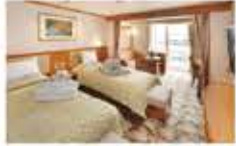
ジュニアスイート / 31㎡