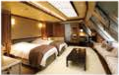
スーパーリアコンセプトルーム / 42㎡