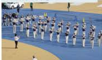
1 日本一のマーチングバンド演奏で出港

マーチングバンドの演奏は、全国一位の受賞歴もある大洗高校のBLUE-HAWKSです。