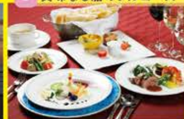
3 美味なる船のフルコース

にっぽん丸は美食の船とうたわれる食事にこだわっている客船です。何度も試行錯誤を繰り返された船上の味わいをぜひ、ご賞味ください。