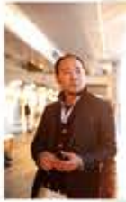
写真家 中村風詩人

船旅専門の写真家。13年間クルーズに継続的に乗船し、三度にわたる世界一周を経験し、海の奇跡の風景を納めた「One Ocean」や島の全てを撮影した完全ガイド「小笠原のすべて」等、海についての著書を多数出版している。