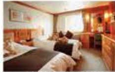
デラックスツイン / 19㎡