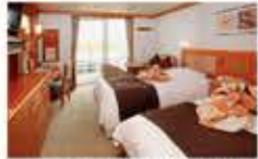
デラックスペランダ / 24㎡