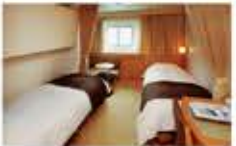
コンフォートステート / 14㎡