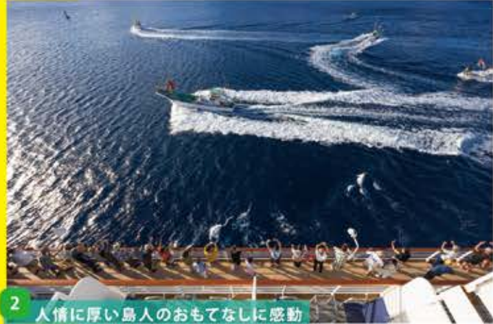
2 人情に厚い島人のおもてなしに感動