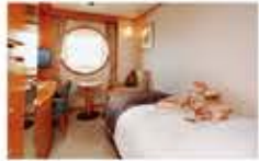
デラックスシングル / 13㎡