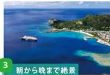
3 朝から晩まで絶景