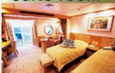
ビスタスイート 37㎡・42㎡・2名1室利用