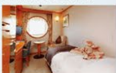
デラックスシングル 13㎡・1名1室利用