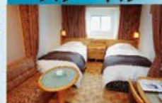
スーペリアツイン 14~18㎡・2~3名1室利用