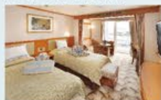
ジュニアスイート 31㎡・2名1室利用