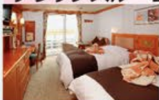
デラックスベランダ 24㎡・2名1室利用