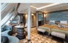
オーシャンビュースイート 33㎡・2名1室利用