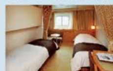
コンフォートステート 14㎡・2~3名1室利用