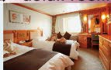
デラックスツイン 19㎡・2名1室利用