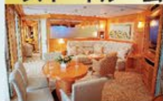
グランドスイート 79㎡・2名1室利用