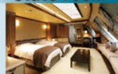
スーペリアコンセプトルーム 42㎡・4~5名1室利用