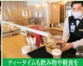
ティータイムも飲み物や軽食をテイクアウトできますので客室でもお召上がりいただけます。