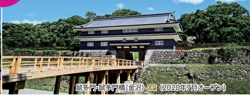
鼠多門・鼠多門橋(金沢) OP (2020年7月オープン)