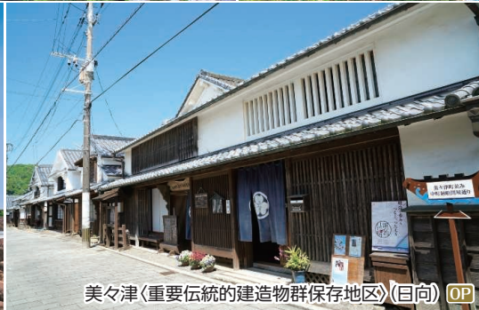
美々津(重要伝統的建造物群保存地区)(目向) OP