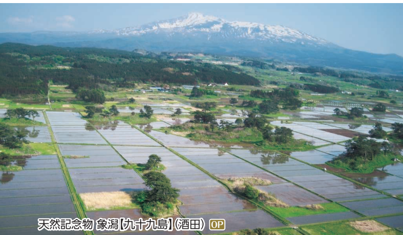
天然記念物 象潟(九十九島)(酒田) OP