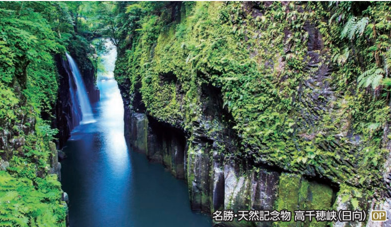
名勝・天然記念物 高千穂峽(目向) OP

OP 2つの世界遺産 白川郷と五箇山を訪ねて II 五箇山・相倉集落、白川郷・萩町集落 和田家 ◆所要時間:約7.5時間 ◆お食事:昼食付