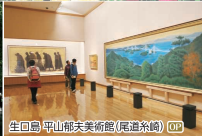
生口島 平山郁夫美術館(尾道糸崎) OP