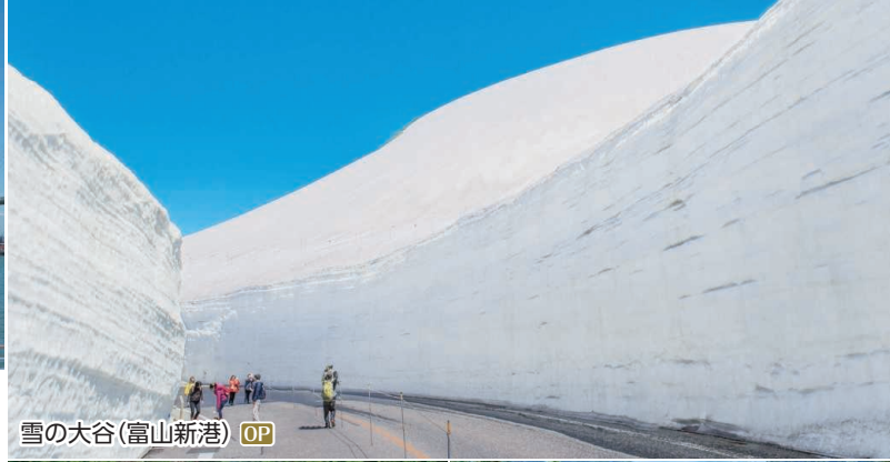
雪の大谷(富山新港) OP