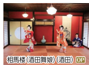
相馬楼(酒田舞娘)(酒田) OP