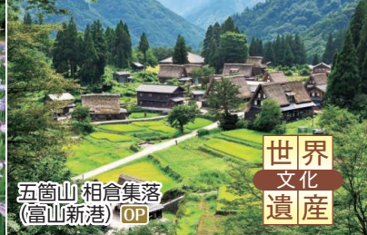
五箇山・相倉集落(富山新港) OP