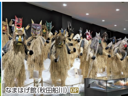
なまはげ館(秋田船川) OP