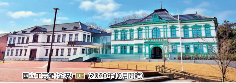
国立工芸館(金沢) OP (2020年10月開館)