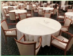
レストランでは座席数を減らします。