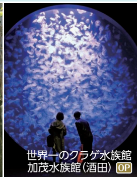
世界一のクラゲ水族館 加茂水族館(酒田) OP