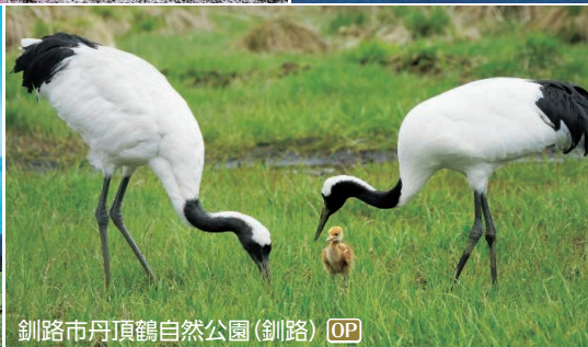
釧路市丹頂鶴自然公園(釧路) OP