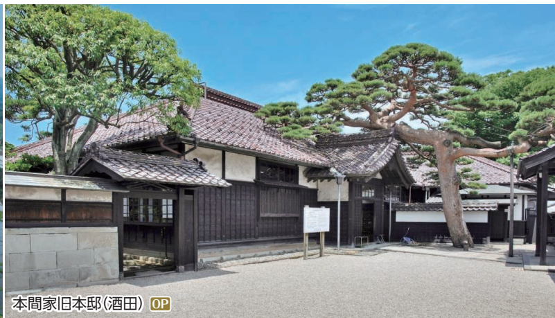
本間家旧本邸(酒田) OP