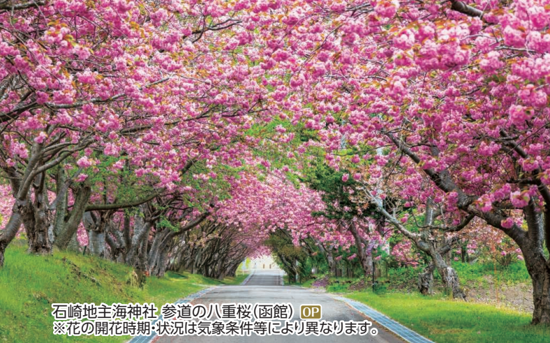
石崎地主海神社 参道の八重桜(函館) OP ※花の開花時期・状況は気象条件等により異なります。