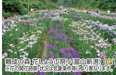
頼成の森花しょうぶ祭り(富山新港) OP ※花の開花時期:状況は気象条件等により異なります。

OP 期間限定!アルペンルート全線開業50周年「雪の大谷メモリアルウォーク」 !! 雪の大谷ウォーク ◆所要時間:約8時間 ◆お食事:昼食付