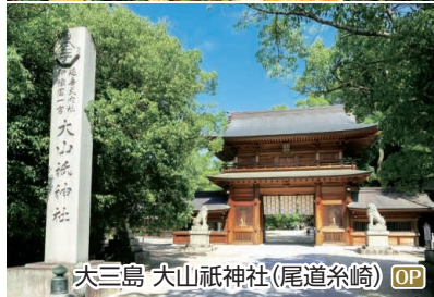
大三島 大山祇神社(尾道糸崎) OP