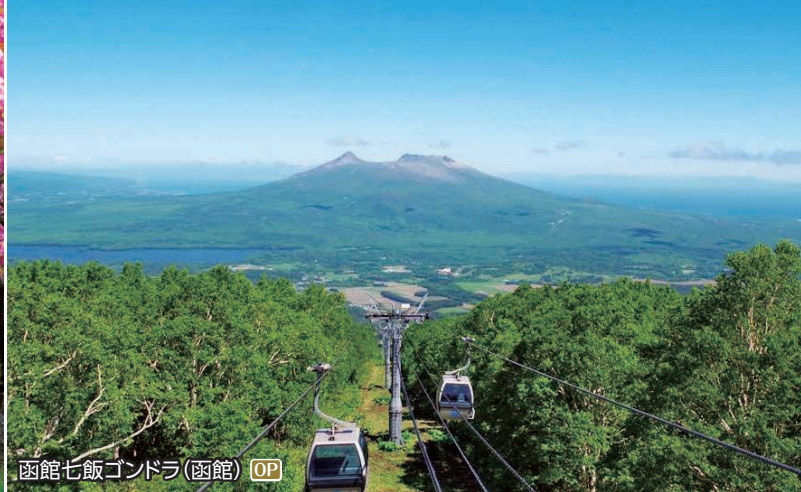
函館七飯 Gondola (函館) OP