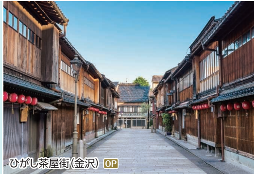
ひがし茶屋街(金沢) OP

加賀百万石の城下町の歴史を今に伝える史跡が多く残されており、昔日の風情を感じられます。新しい観光スポットも出来、さらに魅力を増しています。