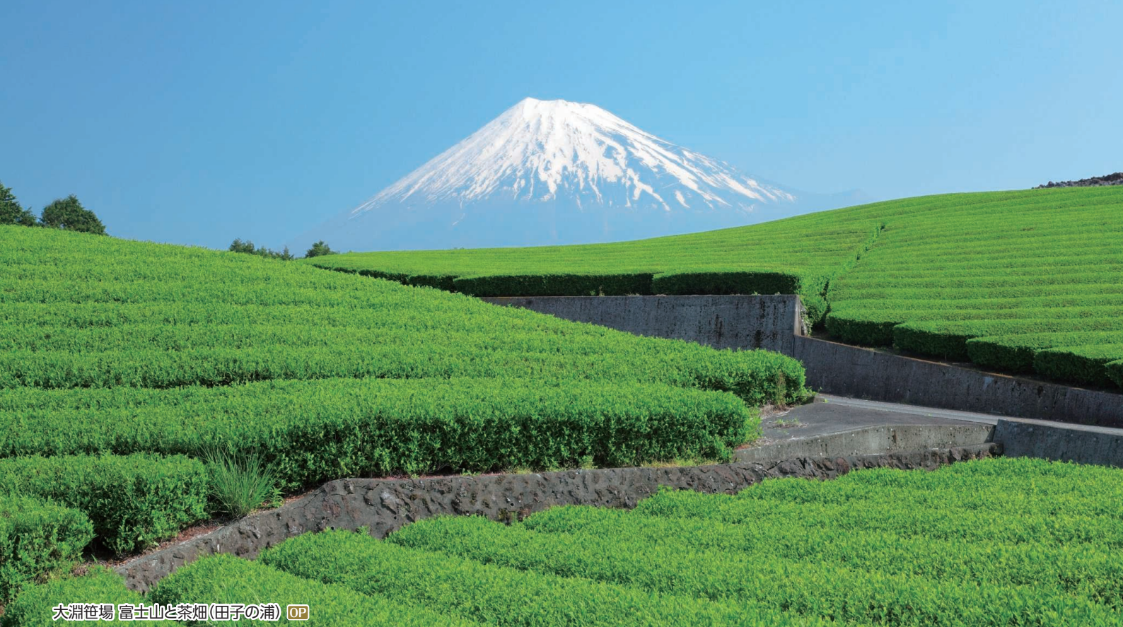
大淵笹場 富士山と茶畑(田子の浦) OP