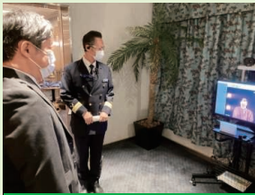
レストランでの検温