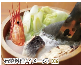
石焼料理(イメージ) OP

寒風山、なまはげ館、真山神社、雲昌寺、入道崎 ◆所要時間:約7時間 ◆お食事:石焼料理の昼食付