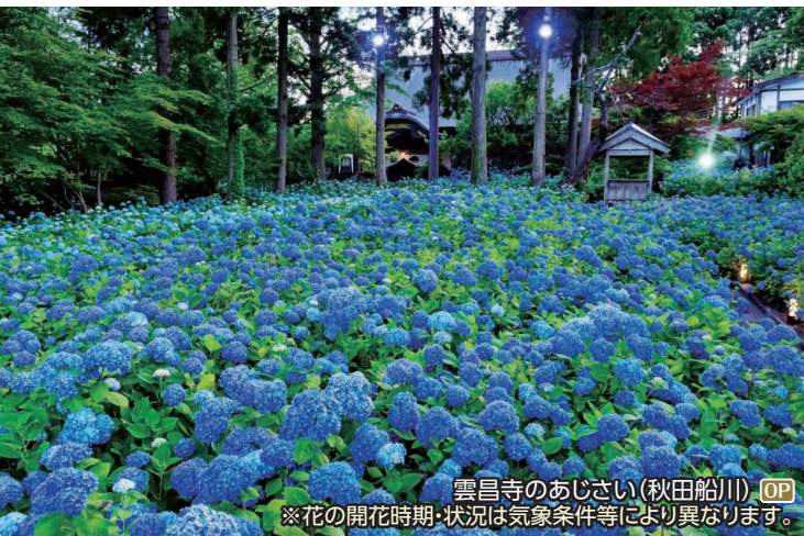
雲昌寺のあじさい(秋田船川) OP ※花の開花時期・状況は気象条件等により異なります。

白老八幡神社、仙台藩白老陣屋跡、ウポポイ(国立アイヌ民族博物館・伝統芸能鑑賞) ◆所要時間:約7.5時間 ◆お食事:昼食付