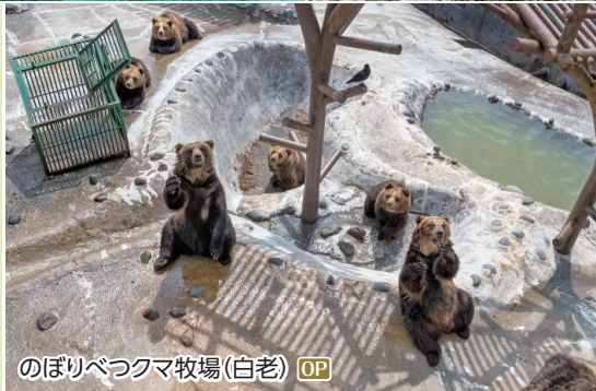
のぼりべつクマ牧場(白老) OP

太平洋側に面した町で、海・山・森林など豊かな自然に恵まれています。この地には昔からアイヌ民族の集落があり、アイヌ民族の歴史と文化を感じられる町です。