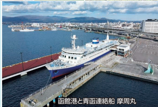
函館港と青函連絡船 摩周丸

建ち並ぶ教会や洋館、坂が織りなす異国情緒漂う街並み、幕末の歴史に翻弄された史跡をはじめ、旬の味覚が楽しめる朝市など多彩な魅力にあふれています。