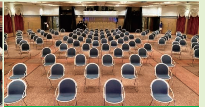
メインホール・メインラウンジは席の間隔をあけてお座りいただけます。