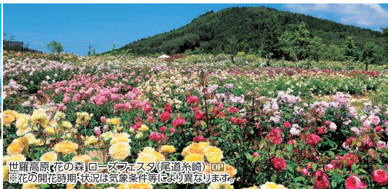
世羅高原・花の森「ローズフェスタ」(尾道糸崎) OP ※花の開花時期:状況は気象条件等により異なります。