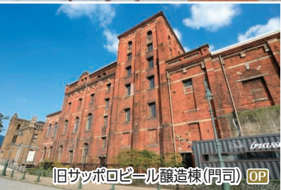
旧サッポロビール醸造棟(門司) OP

OP 世界文化遺産「神の宿る島」の聖地 宗像大社へ !! 宗像大社(辺津宮)、新原・奴山古墳群、宮地嶽神社 ◆所要時間:約7.5時間 ◆お食事:昼食付