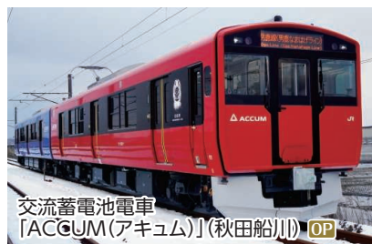
交流蓄電池電車「ACCUM(アキュム)」(秋田船川) OP

寒風山、小玉家住宅特別見学・小玉醸造見学、男鹿線ローカル列車乗車(上二田~男鹿駅) ◆所要時間:約6.5時間 ◆お食事:昼食付