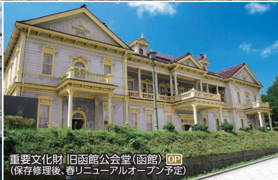
重要文化財 旧函館公会堂(函館) OP (保存修理後、春リニューアルオープン予定)