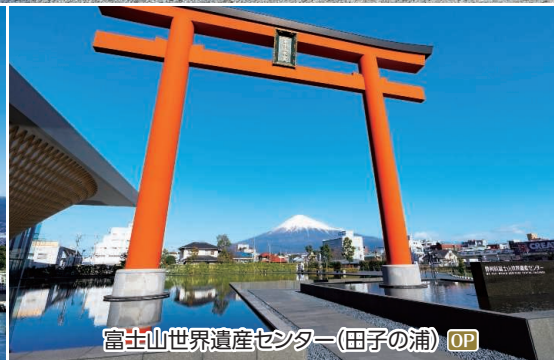
富士山世界遺産センター(田子の浦) OP