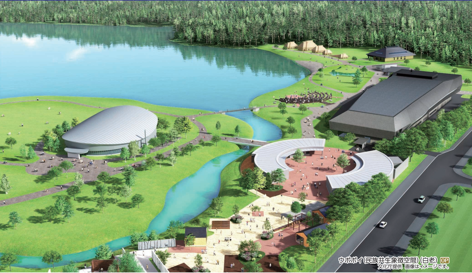
ウポポイ(民族共生象徴空間)(白老) OP 画像はイメージです。