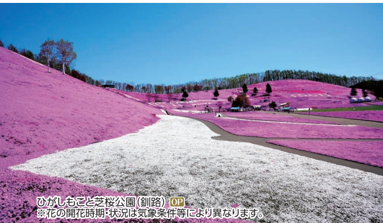
ひがしもと芝桜公園(釧路) OP ※花の開花時期:状況は気象条件等により異なります。

OP 世界遺産!富士山信仰の総本宮「浅間大社」から富士山へ ㉒ 富士山世界遺産センター、富士山本宮浅間大社、富士山五合目 ◆所要時間:約7.5時間 ◆お食事:昼食付