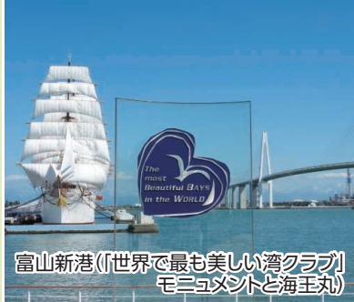
富山新港(「世界で最も美しい湾クラブ」モニュメントと海王丸)

海越しに見える雄大な立山連峰の景観が素晴しく「世界で最も美しい湾クラブ」にも加盟しています。シロエビを初め豊かな海の幸にも恵まれています。