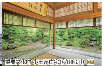
重要文化財 小玉家住宅(秋田船川) OP